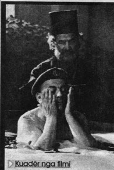
► Kuadër nga filmi

"Anatema" ka kushtuar rreth 700 000 euro, 300.000 nga të cilat janë dhënë nga Ministria e Kulturës. Film do të shfaqet edhe në Pejë, Gjilan, Deçan, Prizren dhe vende të tjera të Kosovës. (a. jasiqi)